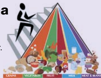
PIRÁMIDE DE ALIMENTOS

Recomienda cuales comidas usted debería comer para ser más sano. Más, le dice cuánto actividad física es ideal para llegar a un peso saludable y quedarse ahí.